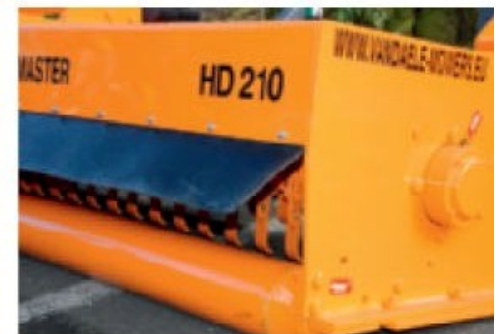
Roulements lourds, rouleau palpeur de grand diamètre, construction robuste.