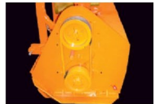
Transmission par un puissant renvoi d'angle et 4 courroies.