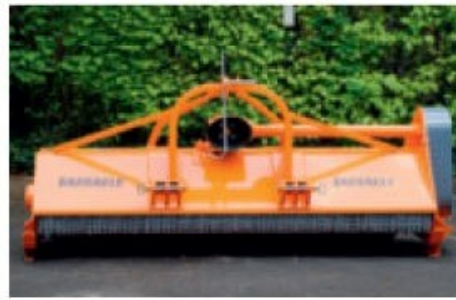
Attelage fixe, sans déport, sur le modèle FLM250.