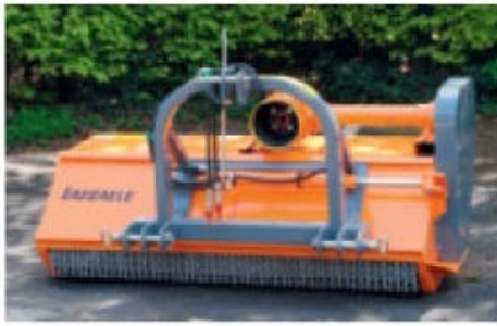
Déport latéral mécanique sur les modèles FLM150 et FLM210 (photo = option déport hydraulique).