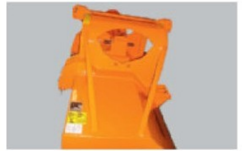
Système 3 points spécialement développé pour attelage arrière ou frontal d'un tracteur.

La débroussailleuse idéale pour entretenir les talus d'autoroutes, les larges accotements et les grandes surfaces. La FLAILMASTER a été conçue pour les travaux extrêmement difficiles. L'expérience de nombreuses années, sa construction solide, son grand rendement font de cette machine un investissement très rentable sur lequel on peut compter pendant plusieurs saisons de fauchage.