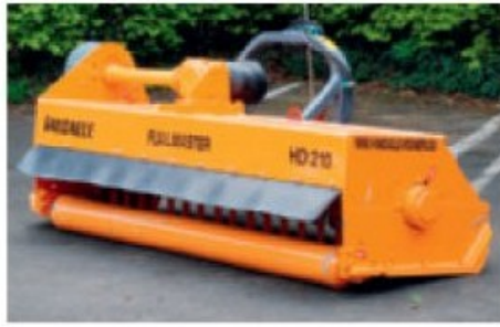
Version standard avec attelage pour relevage 3 points arrière d'un tracteur.

DEBROUSSAILLEUSE A FLEAUX GAMME FLM FLAILMASTER