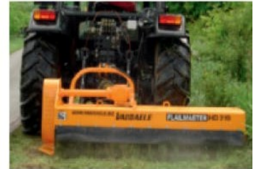
Déport mécanique / hydraulique de 50 cm gauche / droite.