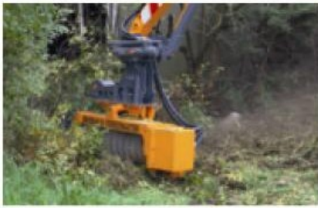
Modèle avec entraînement hydraulique pour pelle hydraulique ou bras de fauchage.