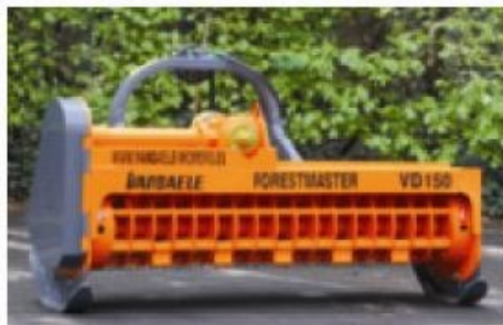
Version mécanique sur attelage 3-points pour tracteurs.

BROYEUR FORESTIER GAMME FRM FORESTMASTER