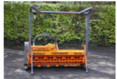
Rabatteur de végétation avec réglage mécanique – carrosse renforcée (option).