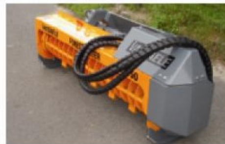
Version avec entraînement hydraulique pour porte-outils.

La machine idéale pour l'entretien et le dégagement de plantations ou de chemins forestiers. Le FRM permet le fauchage d'herbe et le broyage de taillis jusqu'à 10 cm de diamètre.