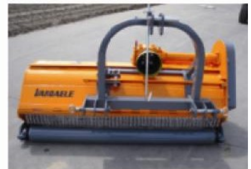
Rouleau palpeur (option).