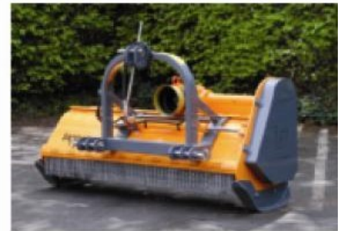
Vérin pour déport latéral hydraulique (option).