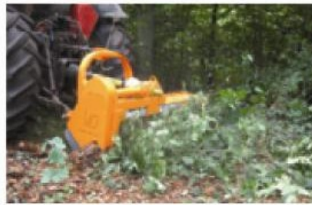
Très compacte pour éviter de blesser les arbres lors des manœuvres, très productive