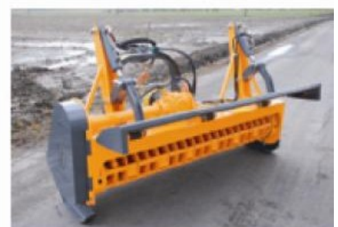
Protection arrière rabattable hydrauliquement à l'aide de 2 vérins (option).