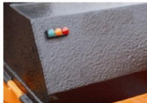
Le système Antistress est standard sur la version diesel; en option pour la version tracteur.