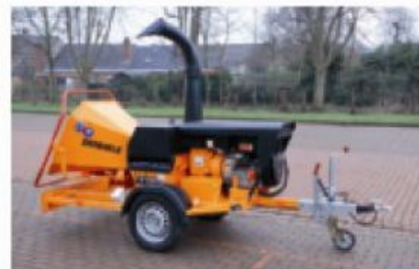
Entraînement par moteur sur châssis pour transport rapide

La junior de notre gamme. Prévue pour le broyage de taille de haies, ou de branches d'un diamètre maximum de 120 mm. Livrée en version entraînement par tracteur ou en version autonome avec moteur diesel.