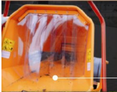
Rideau en matière plastique dans la trémie (option)