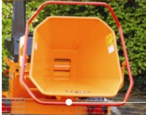
Structure "monocoque" = trémie robuste en une seule pièce, pas de parties rabattables