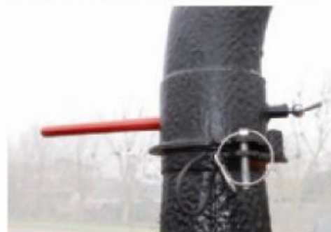
Buse d'éjection orientable sur 300° (raison de sécurité) avec blocage pour le transport.