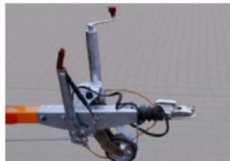
TVI 20 D; châssis remorque avec frein à inertie.

B1: 1200mm B2: 750mm H1: 2200mm H2: 2000mm H3: 1660mm L : 1900mm 426kg