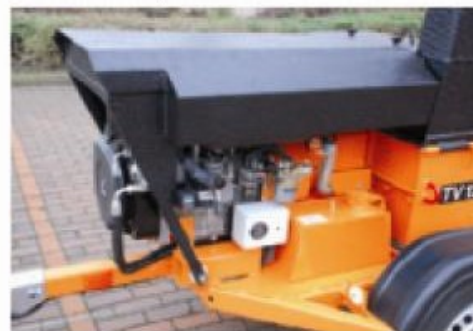
TVI 20 D; moteur diesel LOMBARDINI refroidi par air, 2 cylindres, 21 kW - 28.5 CV.