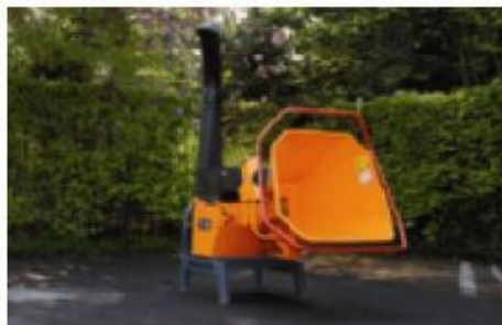
Machine standard – entraînée par la prise de force d'un tracteur