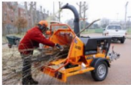
TVI 20 D; moteur diesel puissant et surdimensionné.