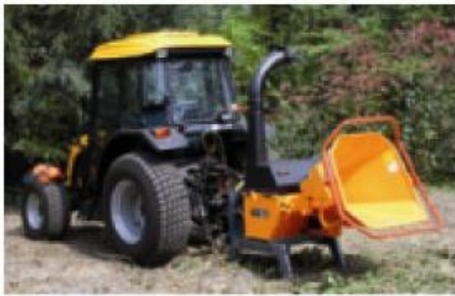
TVI 20 P; entraînement possible par un petit tracteur à partir de 20 CV.