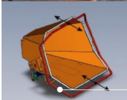
Sécurité optimale de l'opérateur par un arceau de commande entourant totalement le seuil de la trémie (brevet VANDAELE® n° 2003/0590).