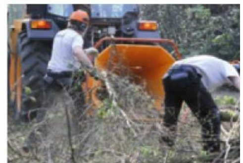
Qualité supérieure, liée à une très haute productivité