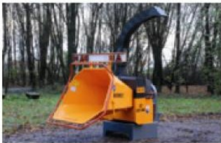
Machine standard – entraînée par la prise de force d'un tracteur