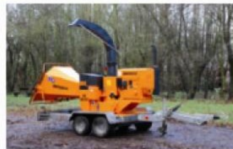
Entraînement par moteur sur châssis pour transport rapide

Machine de taille moyenne pour les utilisateurs professionnels. Prévue pour le broyage de taille de haies, ou de branches d'un diamètre maximum de 200 mm. Disponible en version tracteur et en version avec moteur.