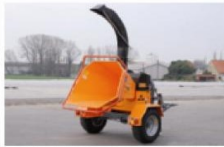
TV20-26 P ; Version entraînée par tracteur sur châssis pour transport lent (option).