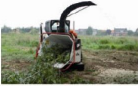
Version avec entraînement hydraulique pour porte-outils.