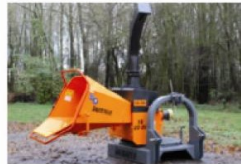
TV20-26 P ; Machine sur 3 points, orientable 2 x 90° (option)