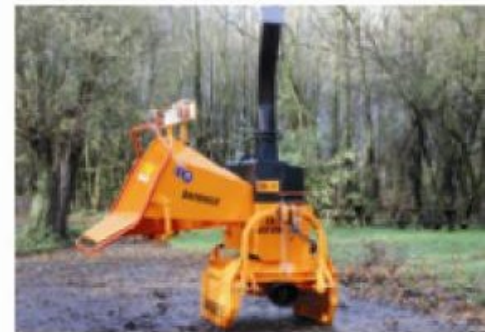
TV20-26 P ; Machine sur 3 points, orientable de 270° (option)